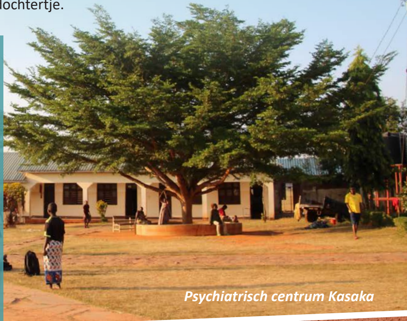
Psychiatrisch centrum Kasaka